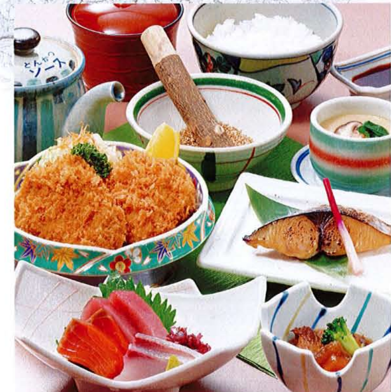
ヒレかつにぎわい膳 麦卵乳 ..... 2,360円 (税込 2,596円) ●ヒレかつ ●刺身 ●焼魚 ●小鉢 ●茶碗蒸し ●ご飯 ●汁物 ●漬物