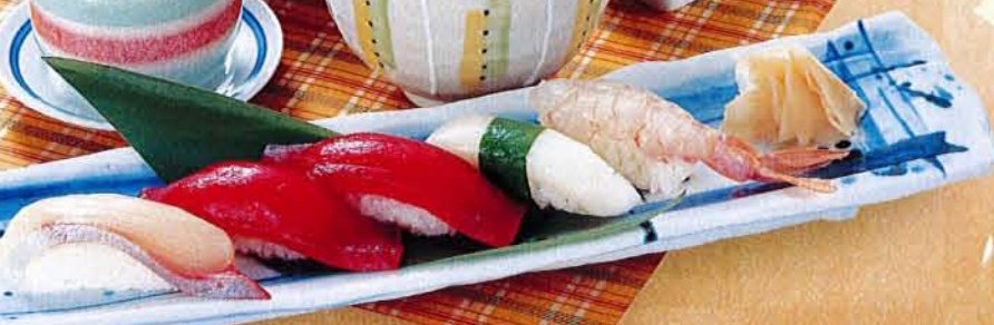
にぎり(竹) 麦卵 1,890円 (税込 2,079円) ●にぎり9貫 ●鉄火巻 ●茶碗蒸し ●汁物