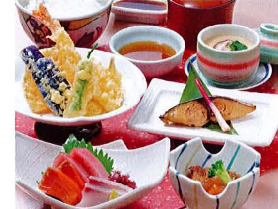
天ぷらごちそう膳 麦卵 ..... 2,300円 (税込 2,530円) ●天ぷら ●刺身 ●焼魚 ●小鉢 ●茶碗蒸し ●ご飯 ●汁物 ●漬物