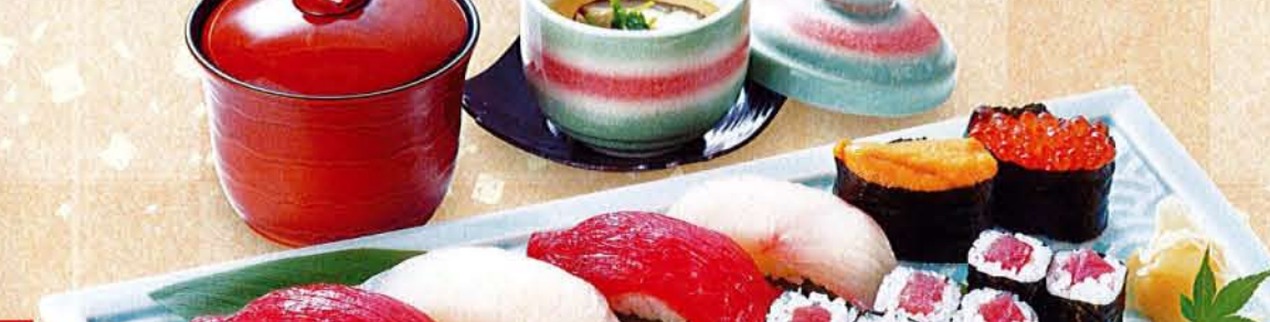
にぎり(竹) 麦卵 1,890円 (税込 2,079円) ●にぎり9貫 ●鉄火巻 ●茶碗蒸し ●汁物