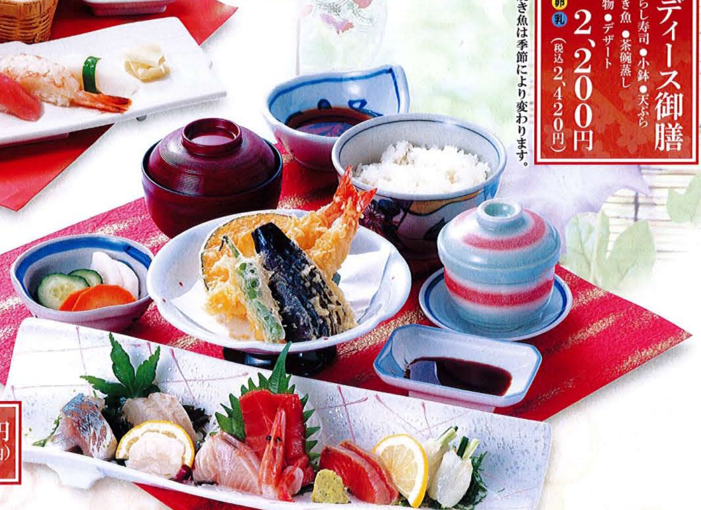
特選和風膳 麦卵 ..... 2,730円 (税込 3,003円) ●刺身盛合せ ●天ぷら ●茶碗蒸し ●ご飯 ●汁物 ●漬物

【アレルギー表記について】 麦小麦卵卵乳乳そそば 特定原材料を使用しているお料理には、アレルギーマークがついております。必ずお確かめ下さい。