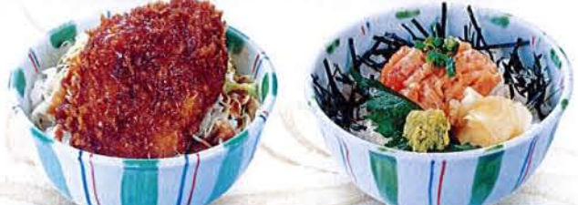
ミニソースかつ丼 麦卵 560円 (税込 616円) ミニねぎとろ丼 麦卵 480円 (税込 528円)