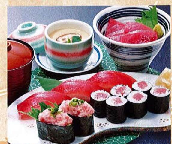
鮭づくし御膳 麦卵 …… 1,980円 (税込 2,178円) ●まぐろにぎり ●ネギとろ ●鉄火巻 ●鉄火丼 ●茶碗蒸し ●汁物