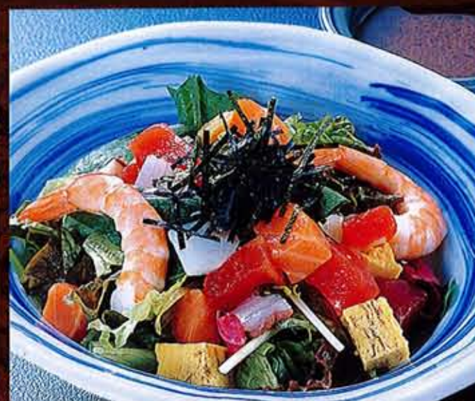
海の幸サラダ 1,130円(税込1,243円)