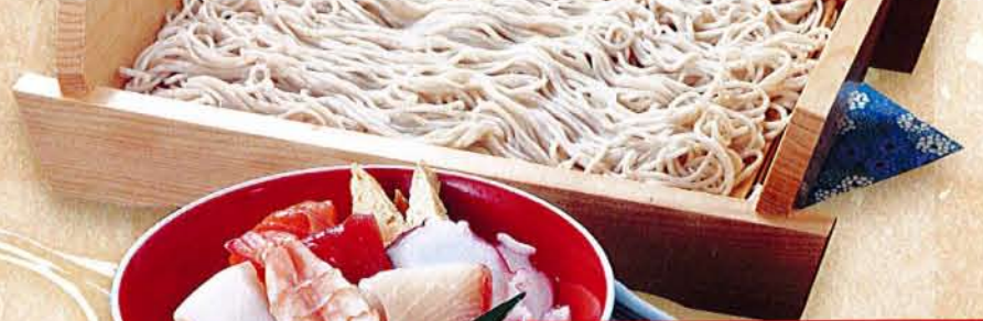
海鮮丼とそばセット 麦卵そ 1,830円 (税込 2,013円) ●海鮮ちらし ●茶碗蒸し ●そば又はうどん(温・冷)