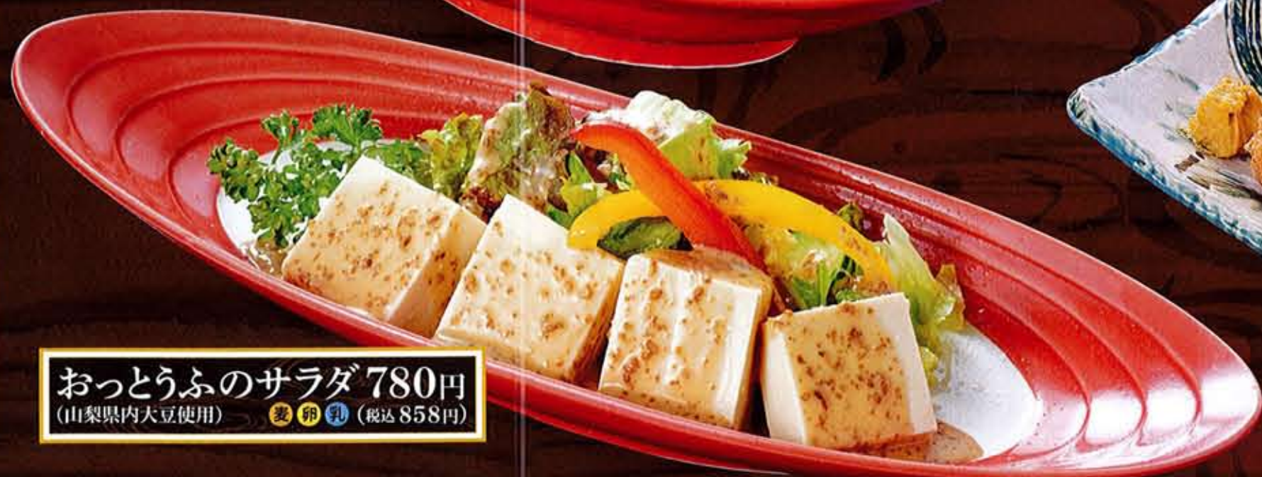
お豆腐のサラダ 780円 (山梨県内大豆使用) (税込858円)