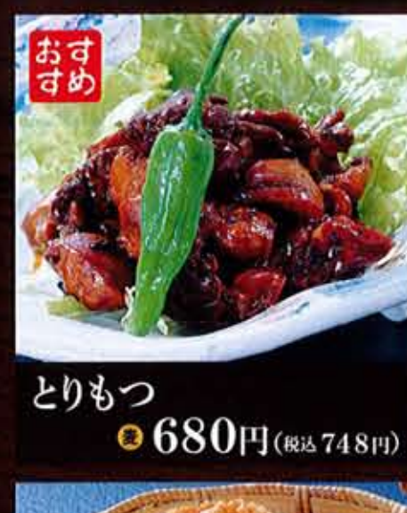
とりもつ 680円(税込748円)