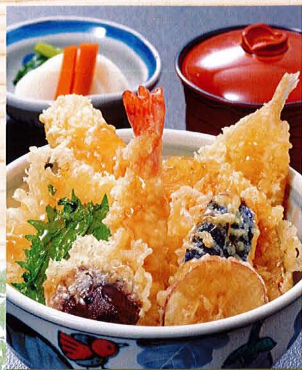
天丼... 1,530円(税込 1,683円) 麦卵