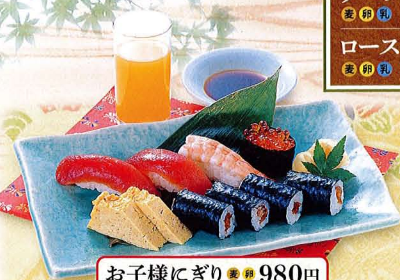
お子様にぎり 麦卵 980円 (税込 1,078円)