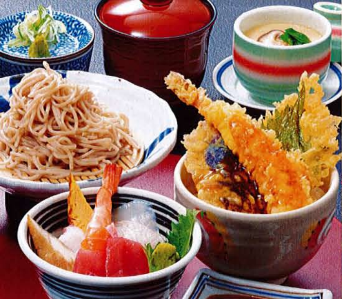
三色セット 麦卵そ …… 1,680円 (税込 1,848円) ●ミニ海鮮丼 ●ミニ天丼 ●ミニそば ●茶碗蒸し ●汁物