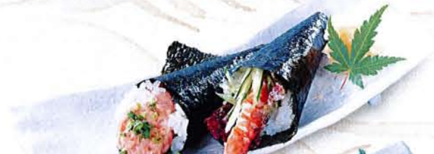
お手軽手巻き 麦卵 580円 (税込 638円) お手軽にぎり 麦卵 490円 (税込 539円)