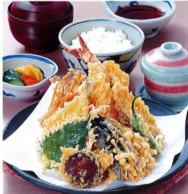
天ぷら定食 麦卵 ..... 1,780円 (税込 1,958円) ●天ぷら盛合せ ●茶碗蒸し ●ご飯 ●汁物 ●漬物