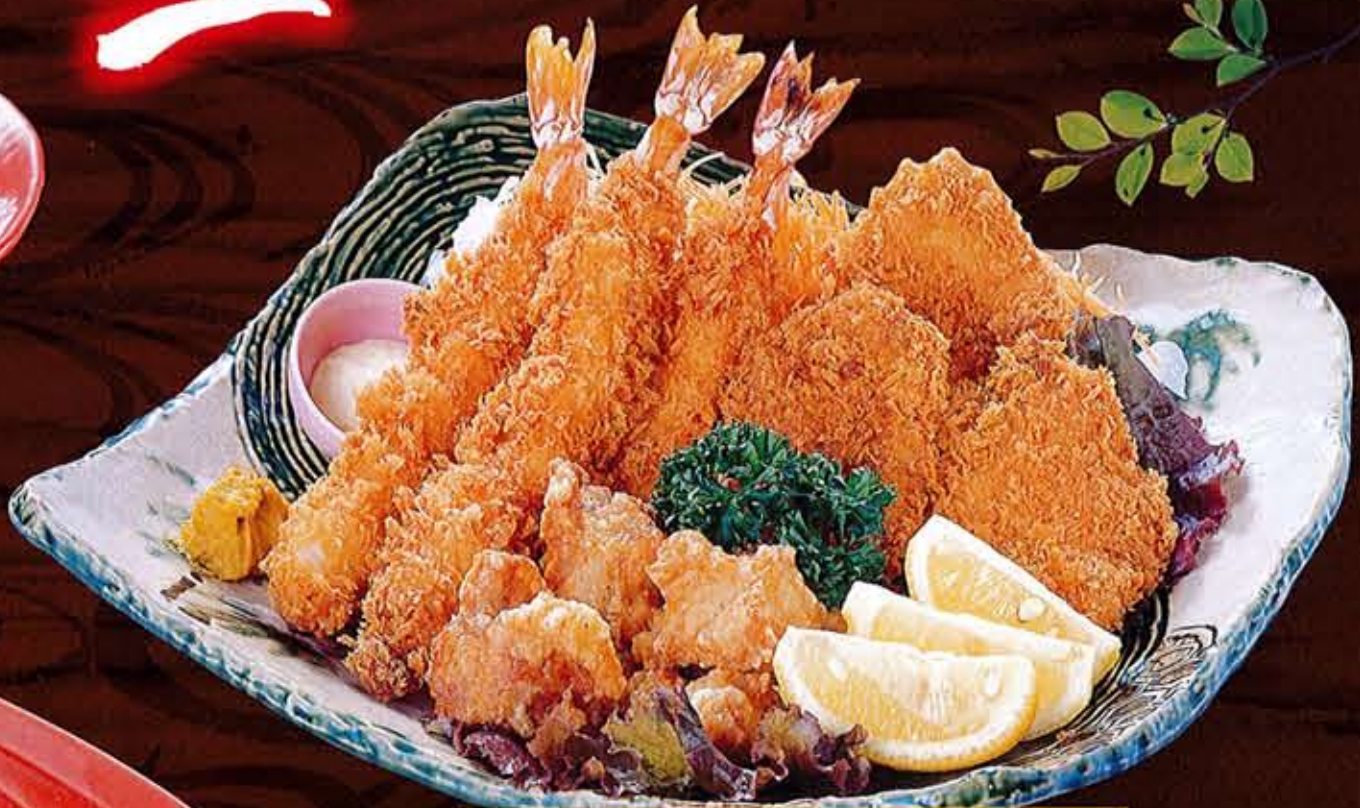
フライ盛合せ 3,880円 (税込4,268円)