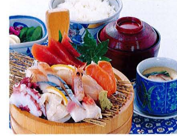
刺身定食 麦卵 ..... 2,100円 (税込 2,310円) ●刺身盛合せ ●茶碗蒸し ●ご飯 ●汁物 ●漬物