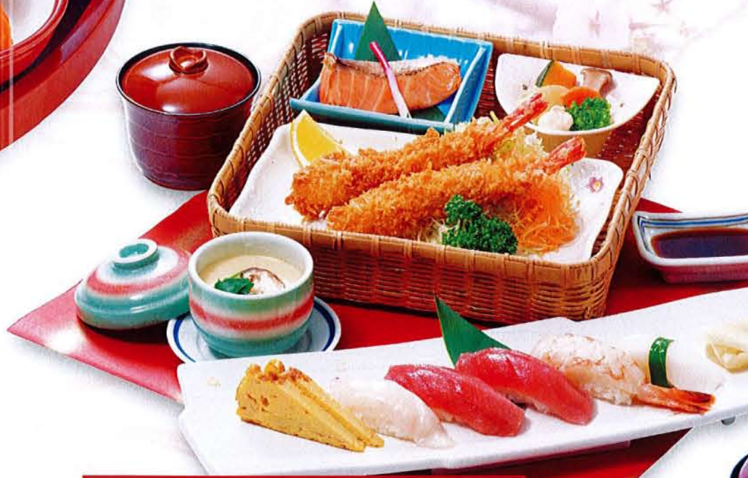
川定食 麦卵乳 ..... 2,290円 (税込 2,519円) ●にぎり寿司 ●海老フライ ●焼魚 ●小鉢 ●茶碗蒸し ●汁物