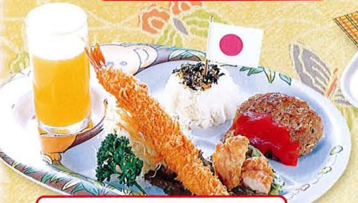
わんぱくセット 麦卵乳 920円 (税込 1,012円)

【アレルギー表記について】 麦小麦 卵卵 乳乳 そそば 特定原材料を使用しているお料理には、アレルギーマークがついております。必ずお確かめ下さい。