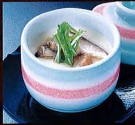
茶碗蒸し 400円(税込440円)