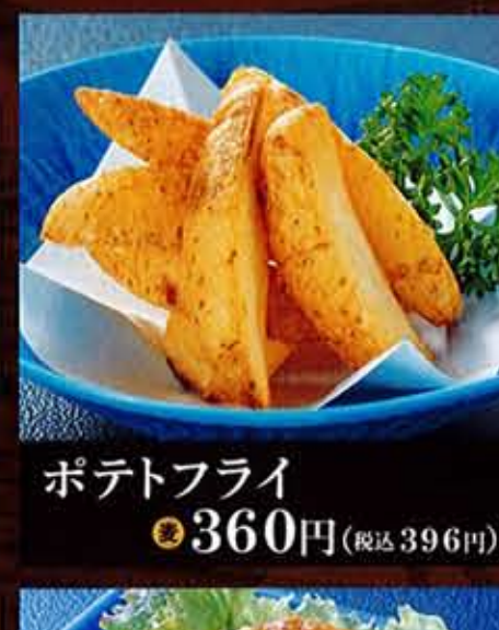
ポテトフライ 360円(税込396円)