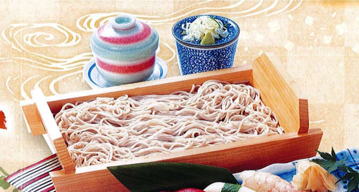
にぎりそばセット 麦卵そ …… 1,630円 (税込 1,793円) ●にぎり5貫 ●茶碗蒸し ●そば又はうどん(温・冷)