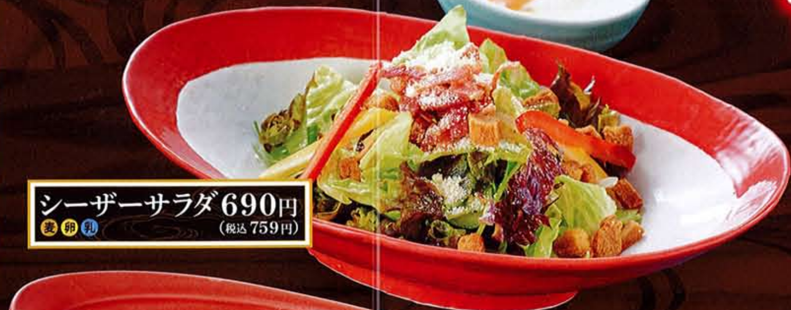
シーザーサラダ 690円 (税込759円)