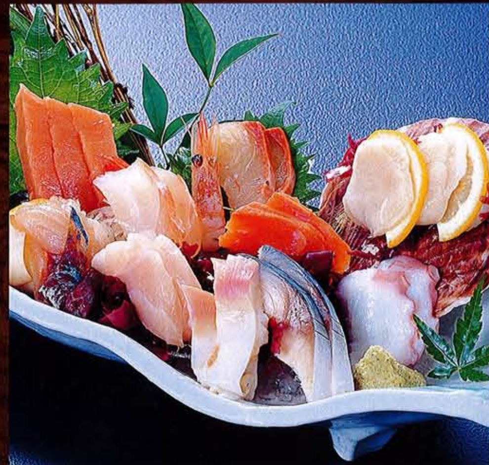
刺身盛合せ.....2,300円(税込2,530円)