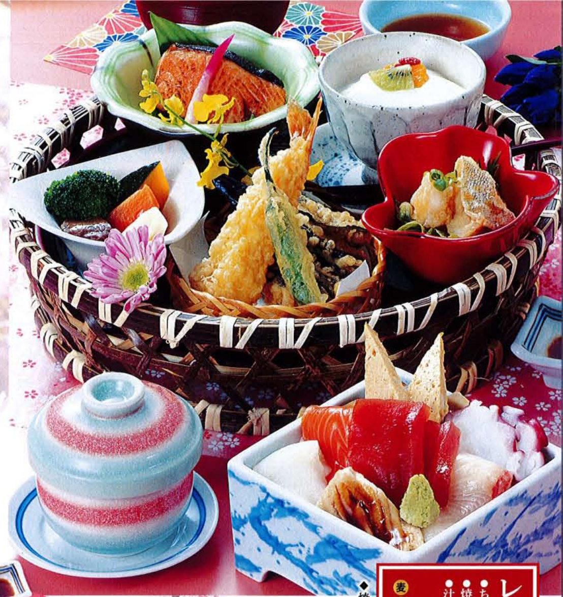
レディース御膳 ●ちらし寿司 ●小鉢 ●天ぷら ●焼魚 ●茶碗蒸し ●汁物 ●デザート 2,200円 (税込 2,420円) ◆焼き魚は季節により変わります。

厳選された旬の素材で楽しむ和風膳。四季折々の味わいと共に、くつろぎのひとときをどうぞ。