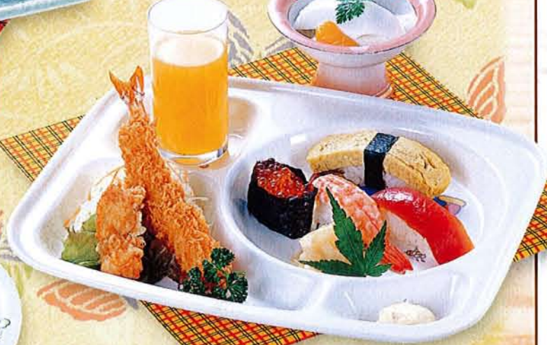
お子様寿司セット 麦卵乳 1,030円 (税込 1,133円)