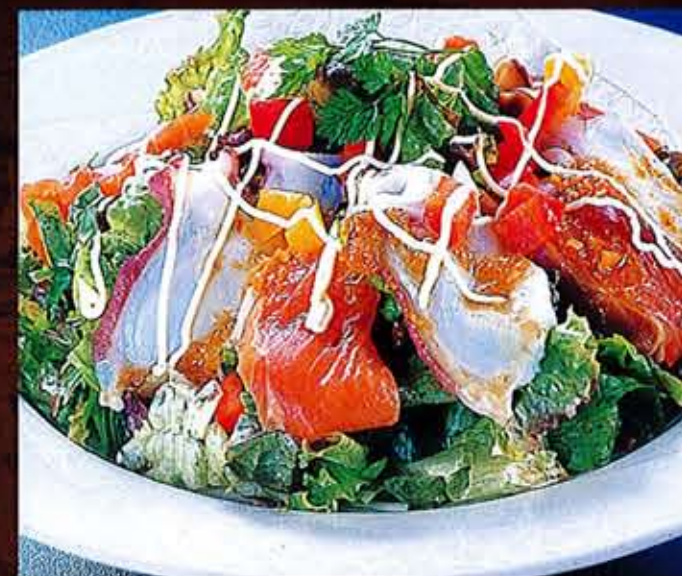
タコとサーモンのカルパッチョ 980円(税込1,078円)