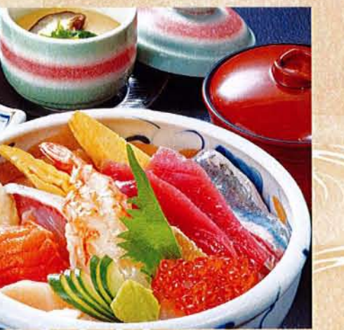
海鮮ちらし(竹) 麦卵 1,930円 (税込 2,123円) 【茶碗蒸し・汁物付き】