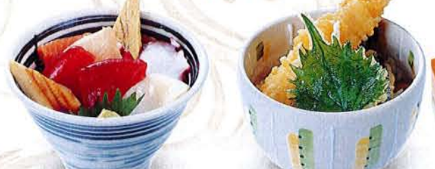
ミニ海鮮丼 麦卵 690円 (税込 759円) ミニ天丼 麦卵 480円 (税込 528円)