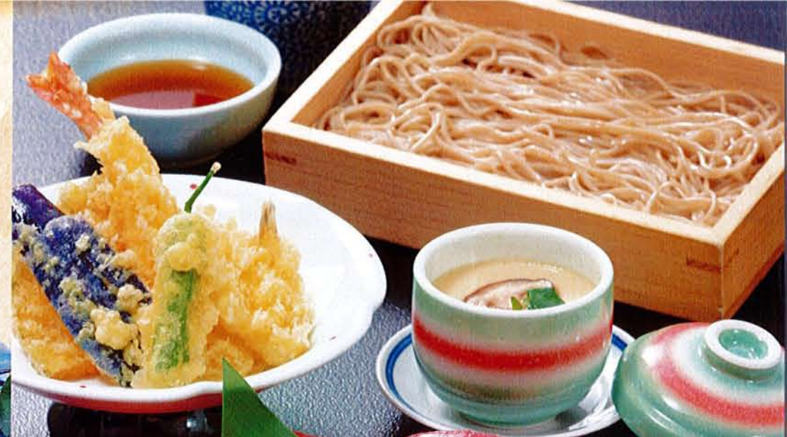
和食のご馳走定番 天ざるにぎりセット 麦卵そ …… 1,980円 (税込 2,178円) ●にぎり6貫 ●茶碗蒸し ●天ぷら ●そば又はうどん(温・冷)