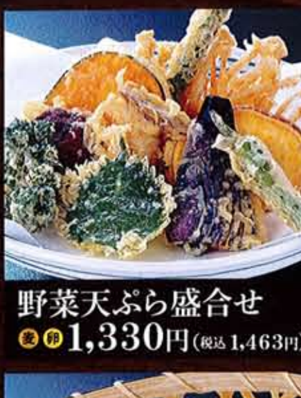
野菜天ぶら盛合せ 1,330円(税込1,463円)