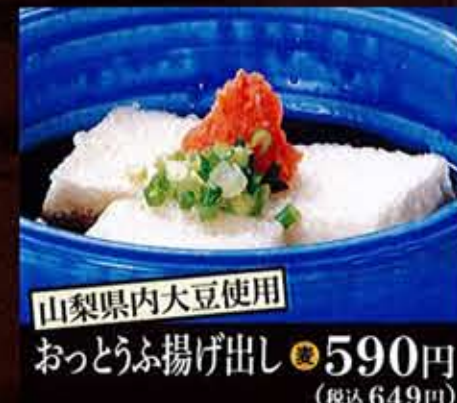
お豆腐揚げ出し 590円(税込649円)

【アレルギー表記について】 小麦 卵 乳 そば 特定原材料を使用しているお料理には、アレルギーマークがついております。必ずお確かめ下さい。