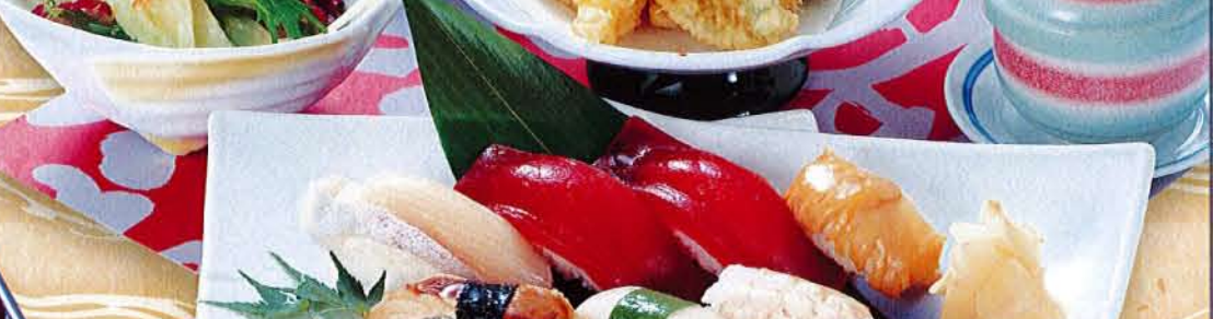
笛吹御膳 麦卵 …… 1,780円 (税込 1,958円) ●にぎり7貫 ●天ぷら ●サラダ ●茶碗蒸し ●汁物