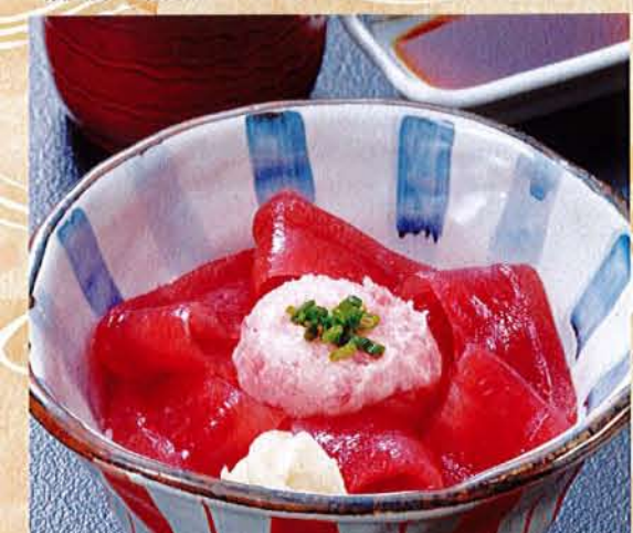
まぐろネギとろ丼 麦 1,680円 (税込 1,848円) 【汁物付き】

セットの麺は自由に選べます。 さるうどん・そば、 あったかうどん・そば からお選び頂けます。