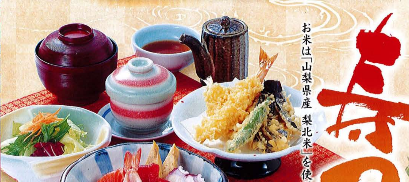
海鮮ちらしのご馳走和膳 富士川御膳 麦卵乳 1,980円 (税込 2,178円) ●海鮮ちらし ●サラダ ●天ぷら ●茶碗蒸し ●汁物

セットの麺は自由に選べます。 さるうどん・そば、 あったかうどん・そば からお選び頂けます。