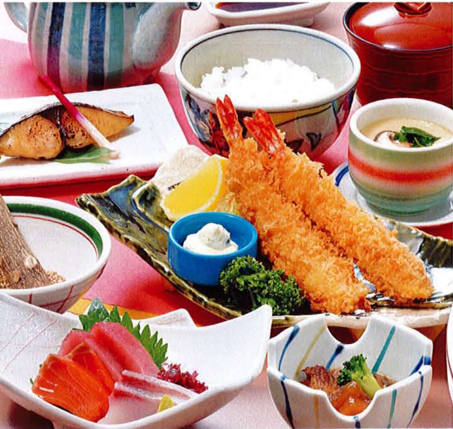
海老フライあじわい膳 麦卵乳 ..... 2,580円 (税込 2,838円) ●海老フライ ●刺身 ●焼魚 ●小鉢 ●茶碗蒸し ●ご飯 ●汁物 ●漬物