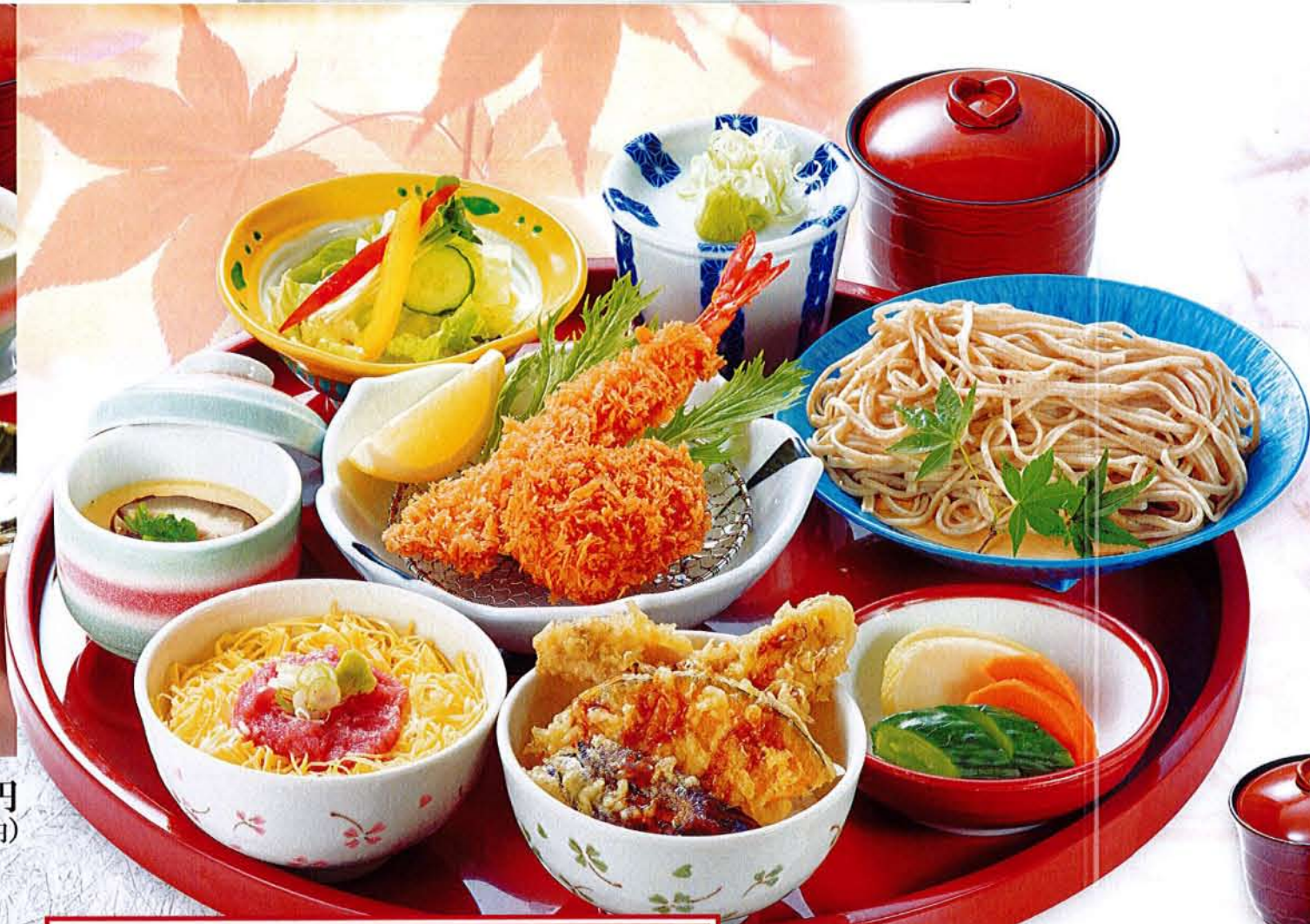
彩り御膳 麦卵乳そ ..... 1,780円 (税込 1,958円) ●ミニねぎとろ丼 ●ミニ天丼 ●海老フライ ●ヒレかつ ●半そば又は半うどん(温・冷) ●茶碗蒸し ●サラダ ●汁物 ●漬物